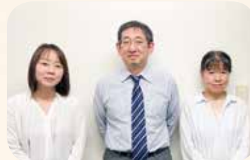
給与チーム (他4名業務中)